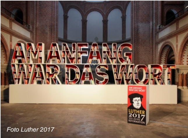
Foto Luther 2017

16. Juli – 6. August 2017: Ausstellung zum Thema Luther mit dem Titel „ Here I stand. Martin Luther, die Reformation und die Folgen “.