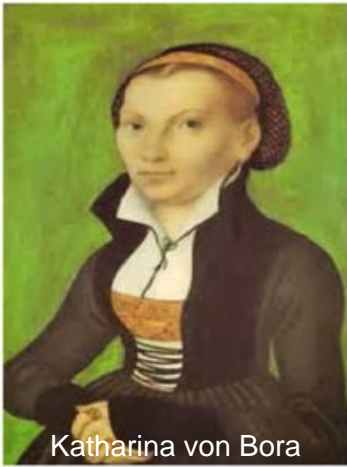
Katharina von Bora