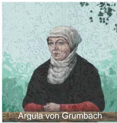
Argula von Grumbach